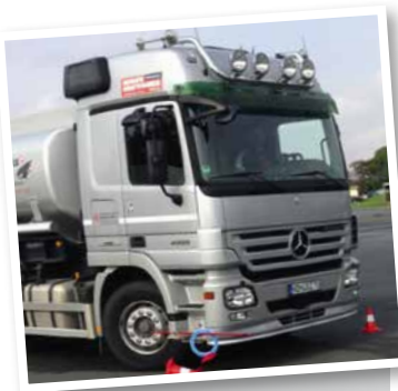
Behendigheid werd gevraagd!

Ringsteken; hier moesten de chauffeurs via een op de bumper bevestigde bezemsteel zoveel mogelijk ringen zien op te pakken die op pylons bevestigd waren.